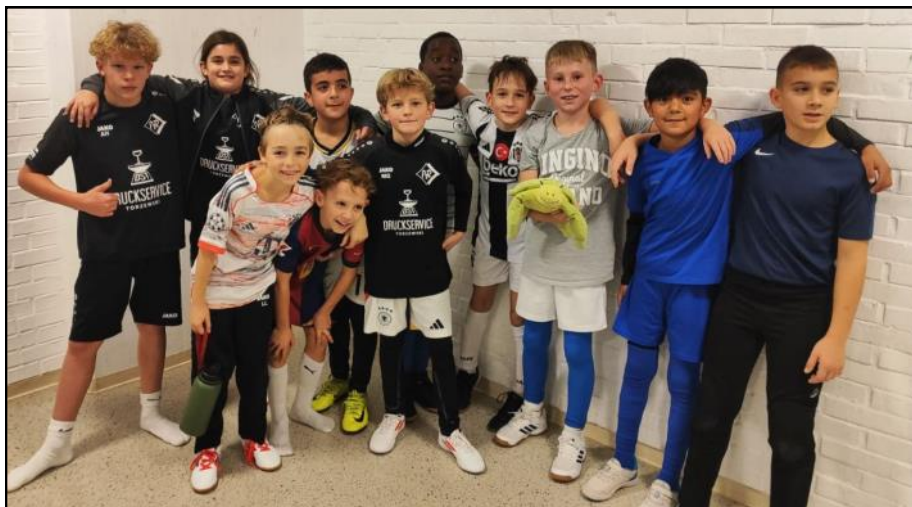
Die E1- Junioren während der Zwischenrunde zur Hallenbezirksmeisterschaft

Die E1-Junioren des FV Bad Rotenfels hatten sich nach der Vorrunde für die Zwischenrunde der Hallenbezirksmeisterschaft qualifiziert.