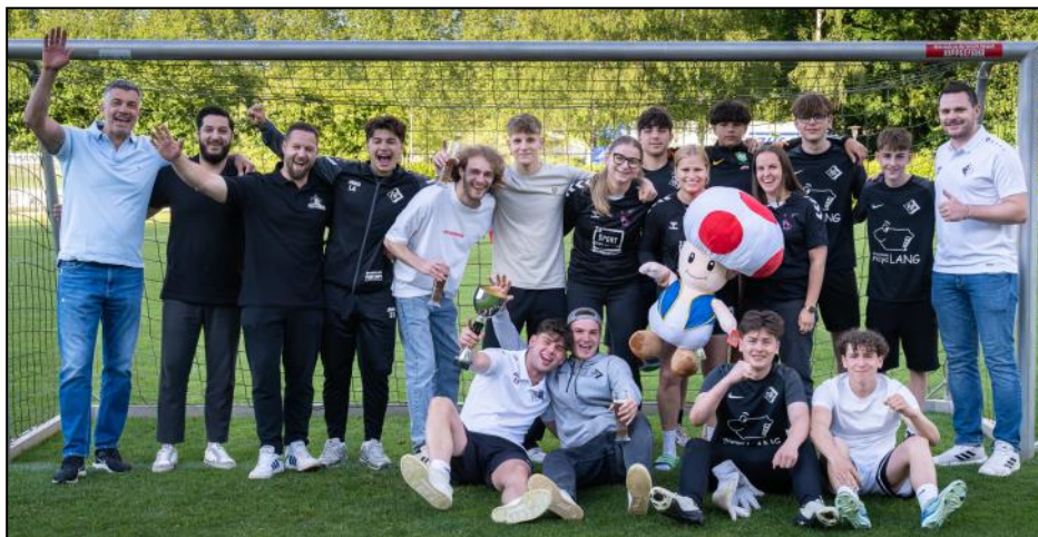
Die Preisträger und Sieger des 9m Turnier der örtlichen Vereine.