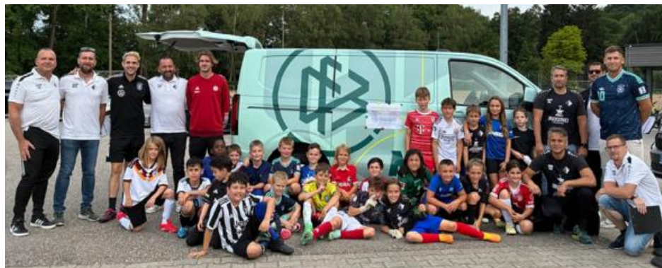
Gruppenbild mit Referenten, Trainern und Spielern vor dem DFB Mobil

Am 09.06.2026 war das DFB-Mobil bei unserem Verein zu Gast und führte ein Demotraining zum Thema „Trainingsphilosophie Deutschland“ durch.