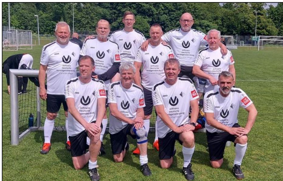
Die Walking-Fußballer des FV Bad Rotenfels.

Beim Walking-Football-Turnier des FV Bad Rotenfels herrschten beste Bedingungen: strahlender Sonnenschein, gute Laune und ein Sportfest, wie man es sich wünscht. Mit dabei waren die gastgebenden Rotenfelser sowie der FV Sandweier, der Musikverein Kartung, der FC Alemannia Eggenstein und der SV 08/29 Friedrichsfeld. Gespielt wurde im Modus „jeder gegen jeden“ – also genug Gelegenheiten für spannende Partien, taktische Meisterleistungen und die ein oder andere kreative Auslegung der Begrifflichkeit „Walking“.